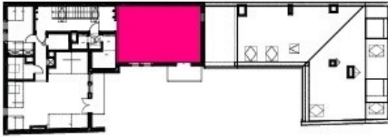
RZUT PODDASZA 1:500