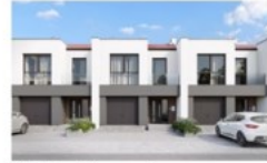
Widok od strony ulicy